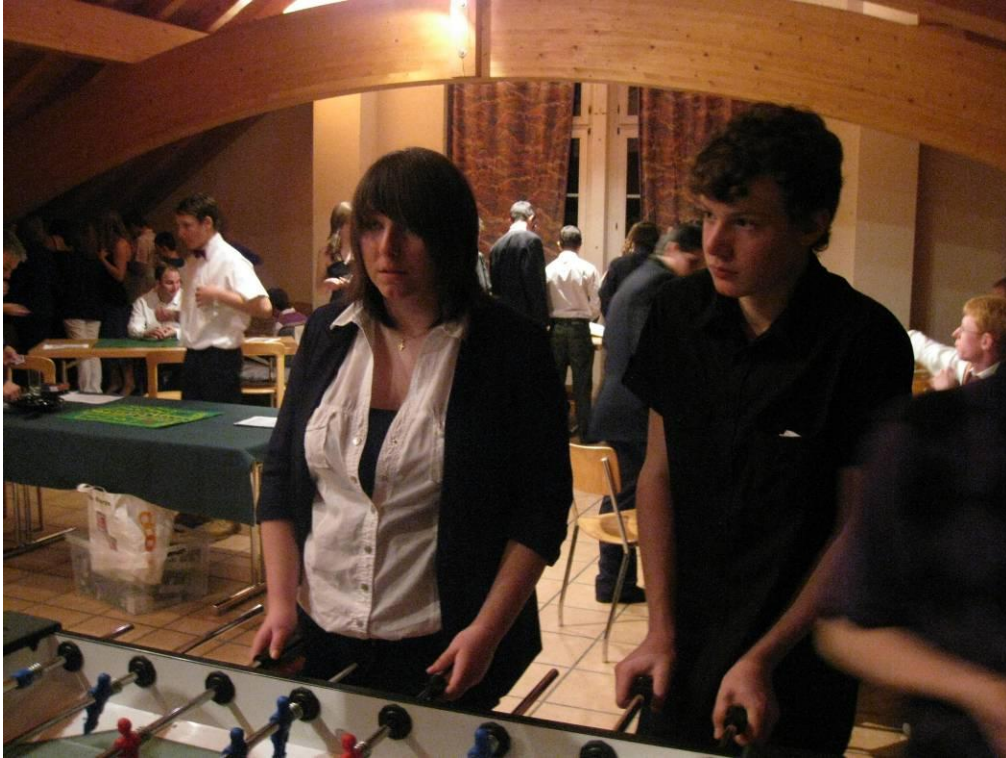
Beim Tischfußball konnte man um Geld spielen, einige hatten Glück und andere etwas weniger.