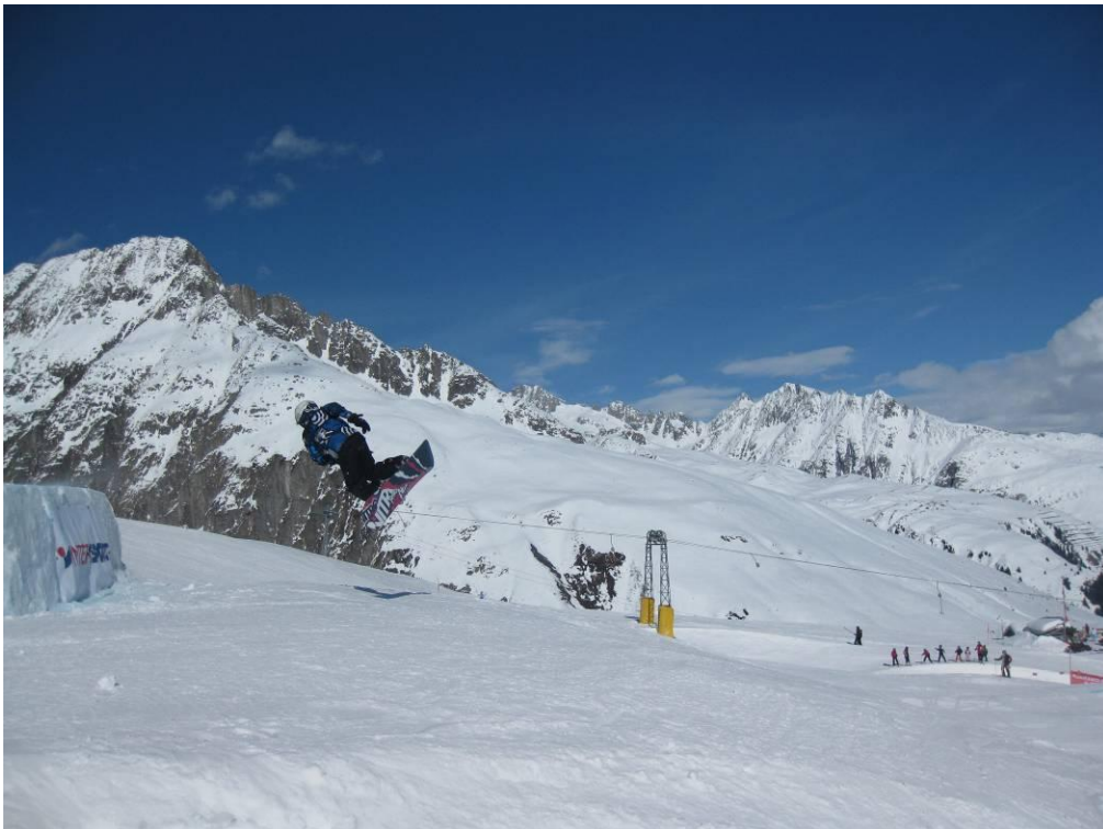
Fabian versuchte auf der Schanze sogar eine halbe Drehung! Ganz mutig!