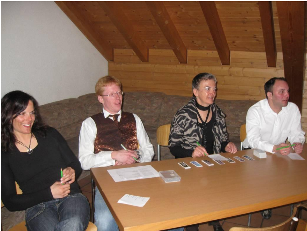
Die Jury beurteilte das Aussehen der einzelnen Gruppen am Casino-Abend.