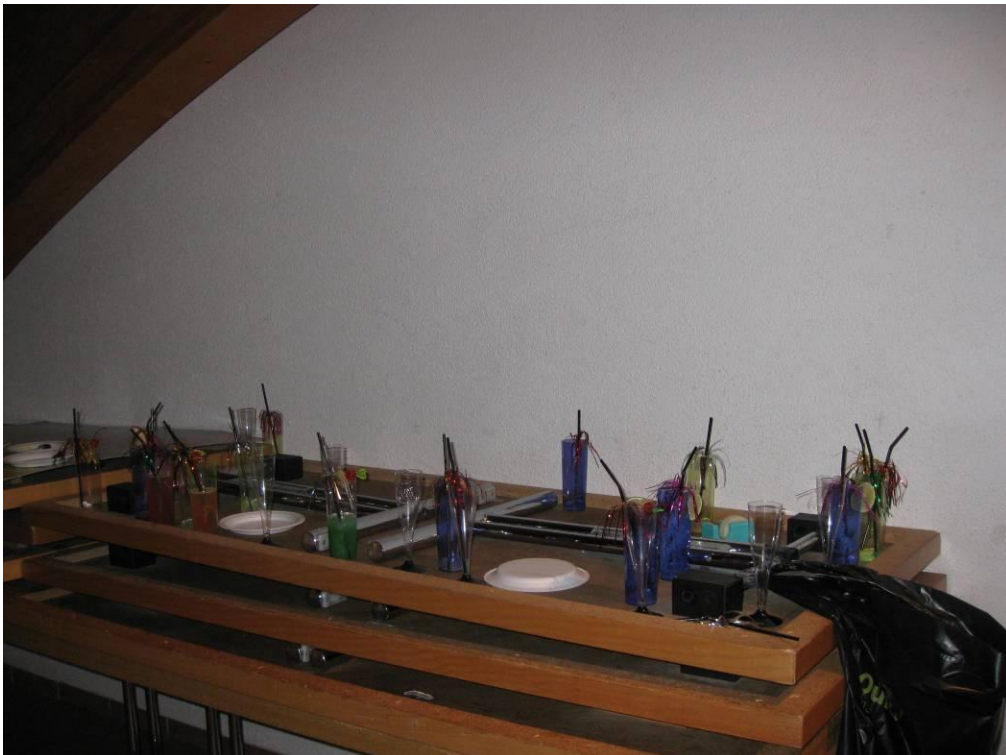
Nach dem Casino-Abend standen überall leere Getränkebecher herum.