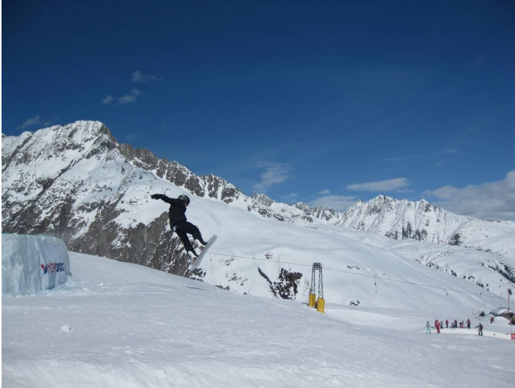
Einige Schüler wagten sogar den Sprung über die grosse Schanze!